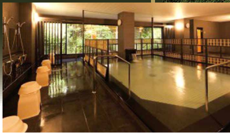
▲天然ラドン温泉 仏陀の湯

グランドコース 絶妙なアンジュレーションが美しい 開放感あふれる丘陵コース。 2007年日本女子プロゴルフ選手権大会も 開催された名門。